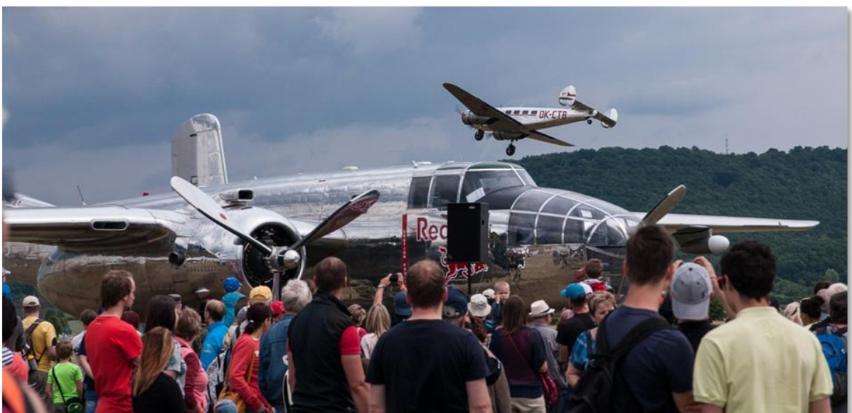
Eine große Anzahl Oldtimer wurde spektakulär vorgeführt: Hans Grade, Bücker Jungmann, Lockheed Electra 10, B-25J, AN2 ... Nach 4 Stunden Besuch der Flugschau setzten wir unsere Fahrt fort.