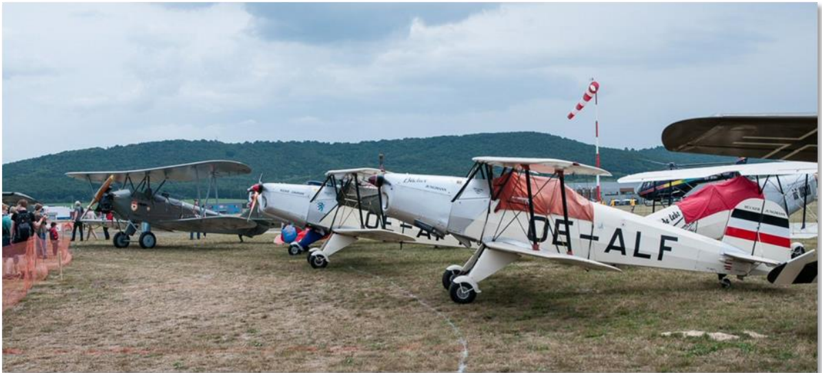
Bücker 'Jungmann' [Nachbau]. Im Original war da wohl kein Funk drin.