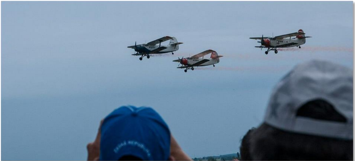
Doppeldecker 'AN2' Gleich drei auf einmal!