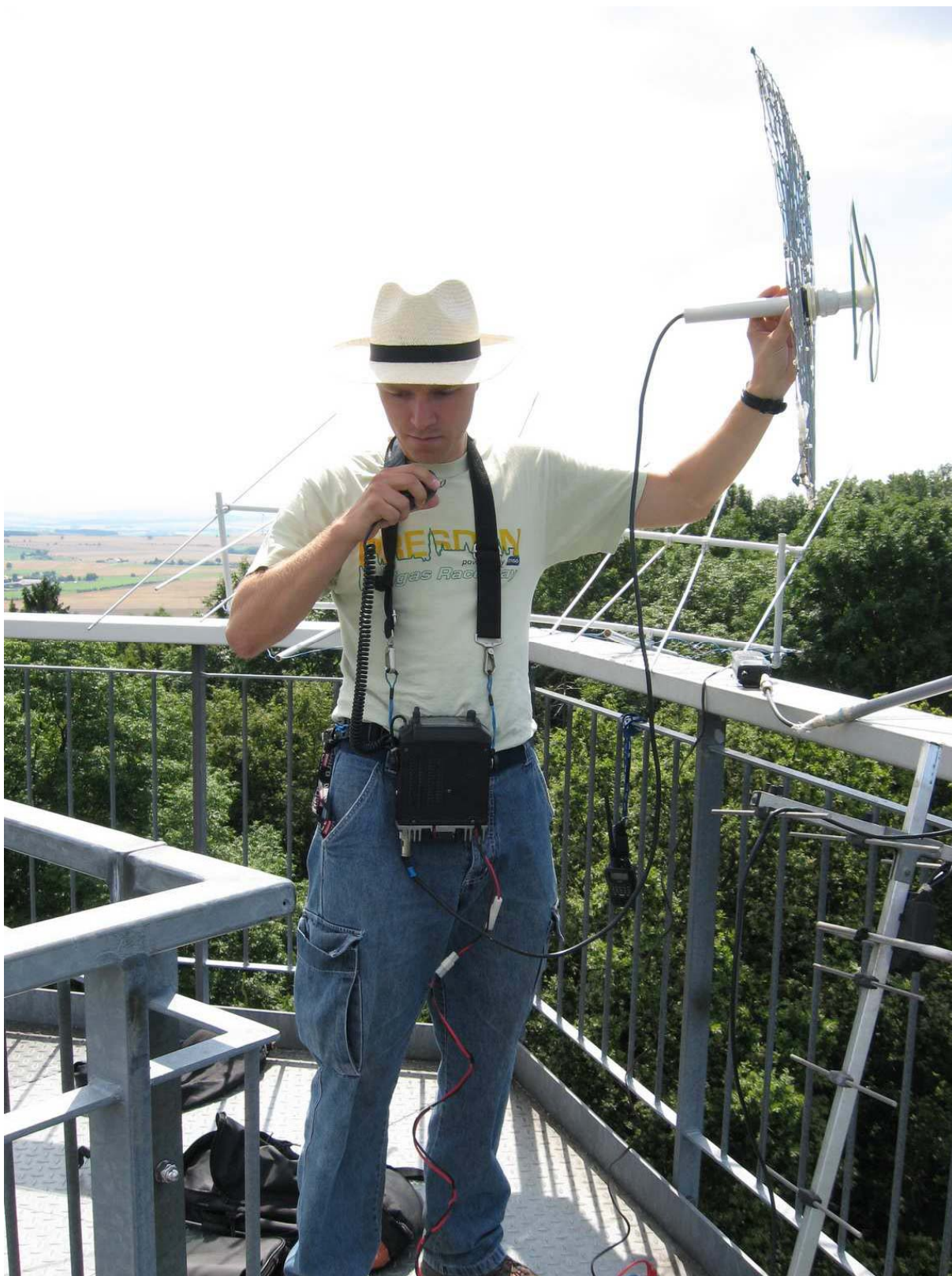
Großfunkstelle DG0VOG auf dem Rotstein.