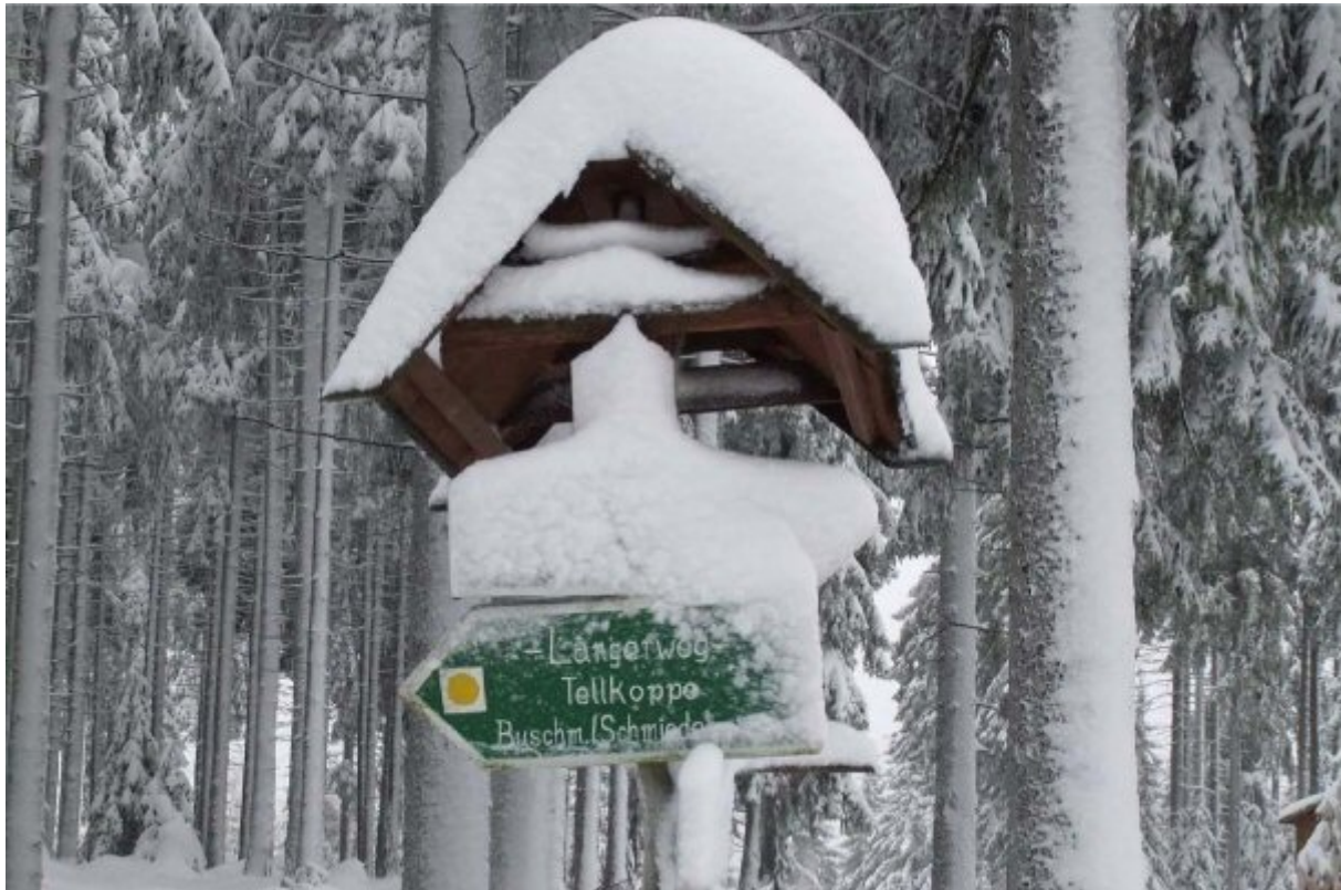
Auf dem Weg zur Tellkoppe.