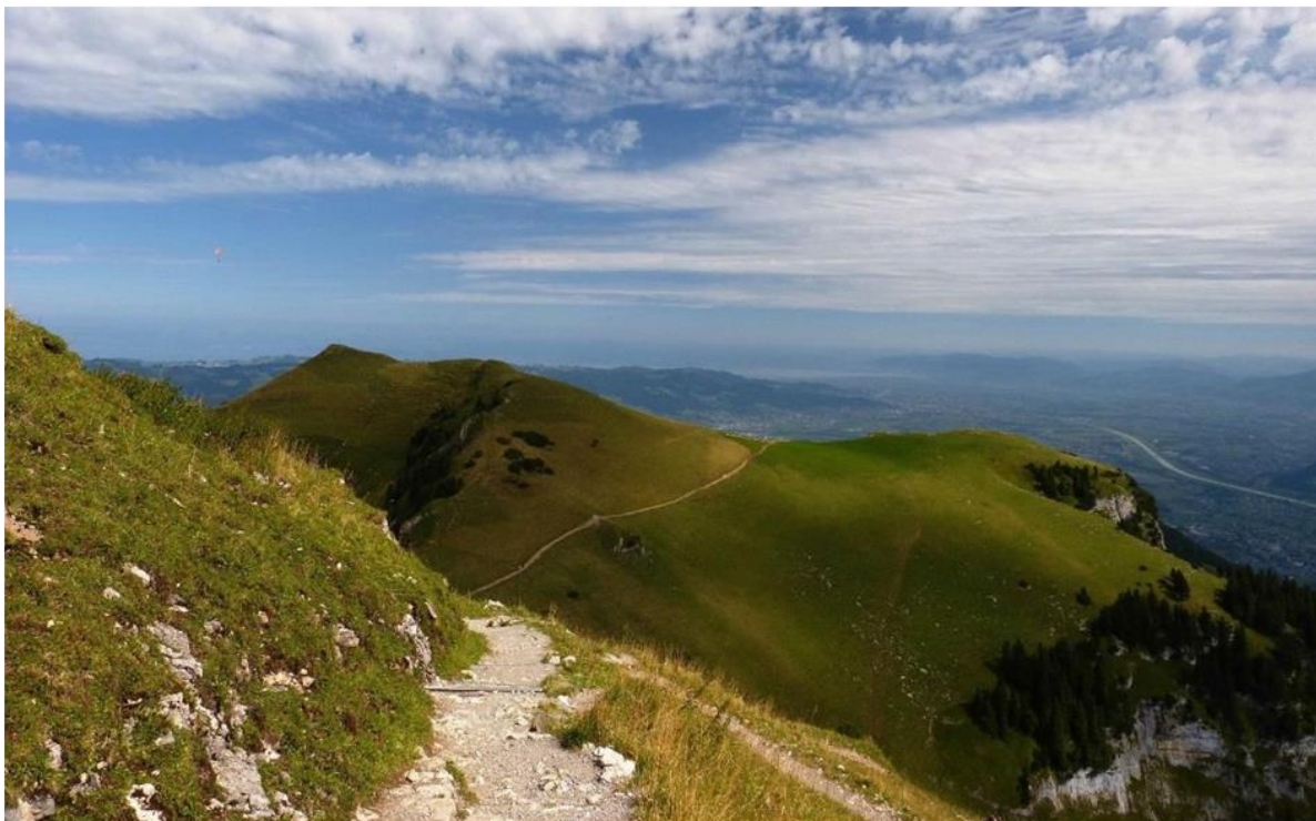
Blick nach Norden. In der Bildmitte ist etwas undeutlich der Bodensee zu sehen.