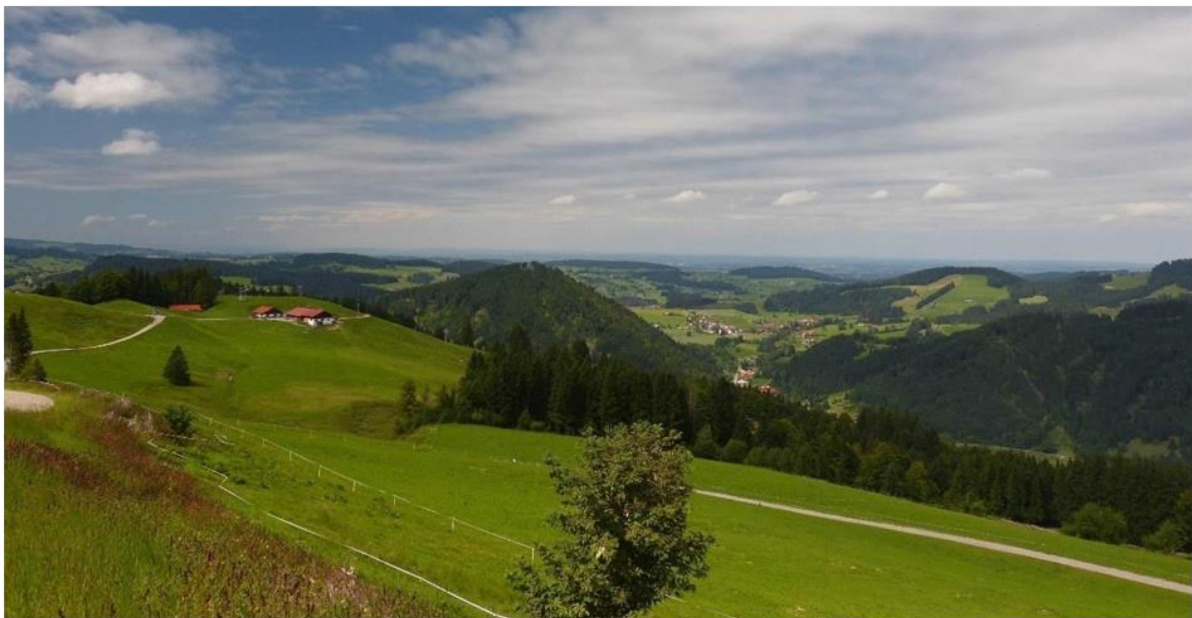
Aussicht vom Hündlekopf nach Nordwesten.

Kampf-Kuh Elsa und ihre schmatzenden Gefährtinnen erweisen sich als übermächtiger Gegner. Fast wäre auch noch die gute Morsetaste verschwunden ... Der Klügere gibt nach. Wir suchen uns ein neues QTH etwas abseits.