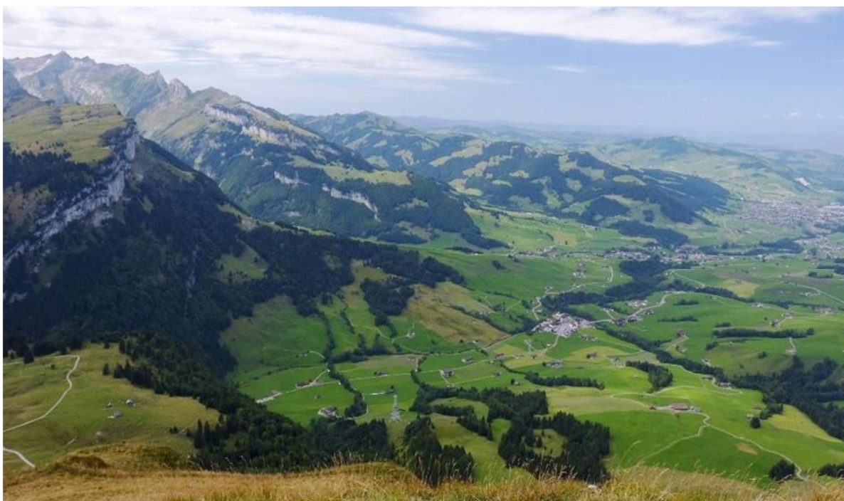
Aussicht vom Hohen Kasten nach Westen.

Über einen 100 Meter tiefer liegenden Sattel geht es nachmittags hinüber zum Kamor [GMA HB9/AI-1002]. Ja - auch in der Schweiz gibt es inzwischen GMA-Berge.