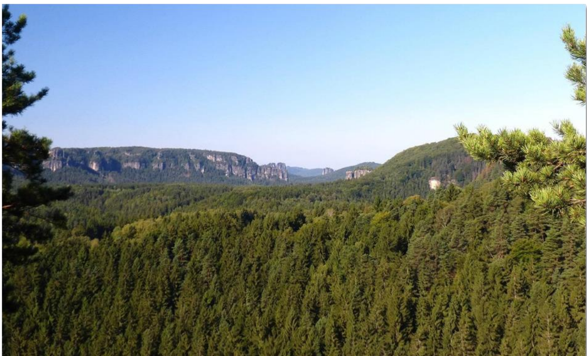
Ausblick nach Süden über das Kirnitzschtal in die Hintere Sächsische Schweiz.