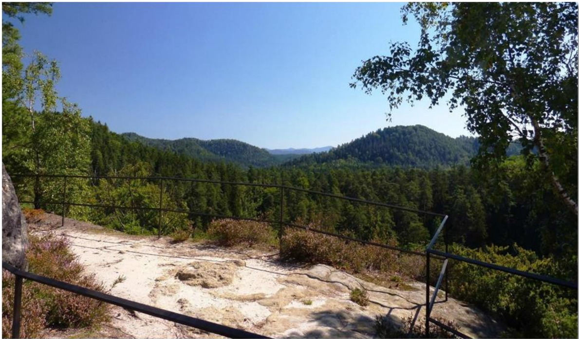
Das Gipfelplateau bietet auch für den verwöhnten Kurzwellenfunker genug Platz.