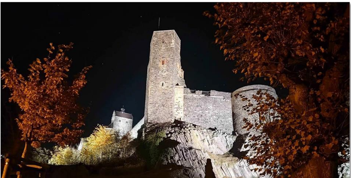
DO2UDX/p. Fast schon 'ne Nachtwanderung. Die Burg Stolpen wird großzügig angestrahlt.