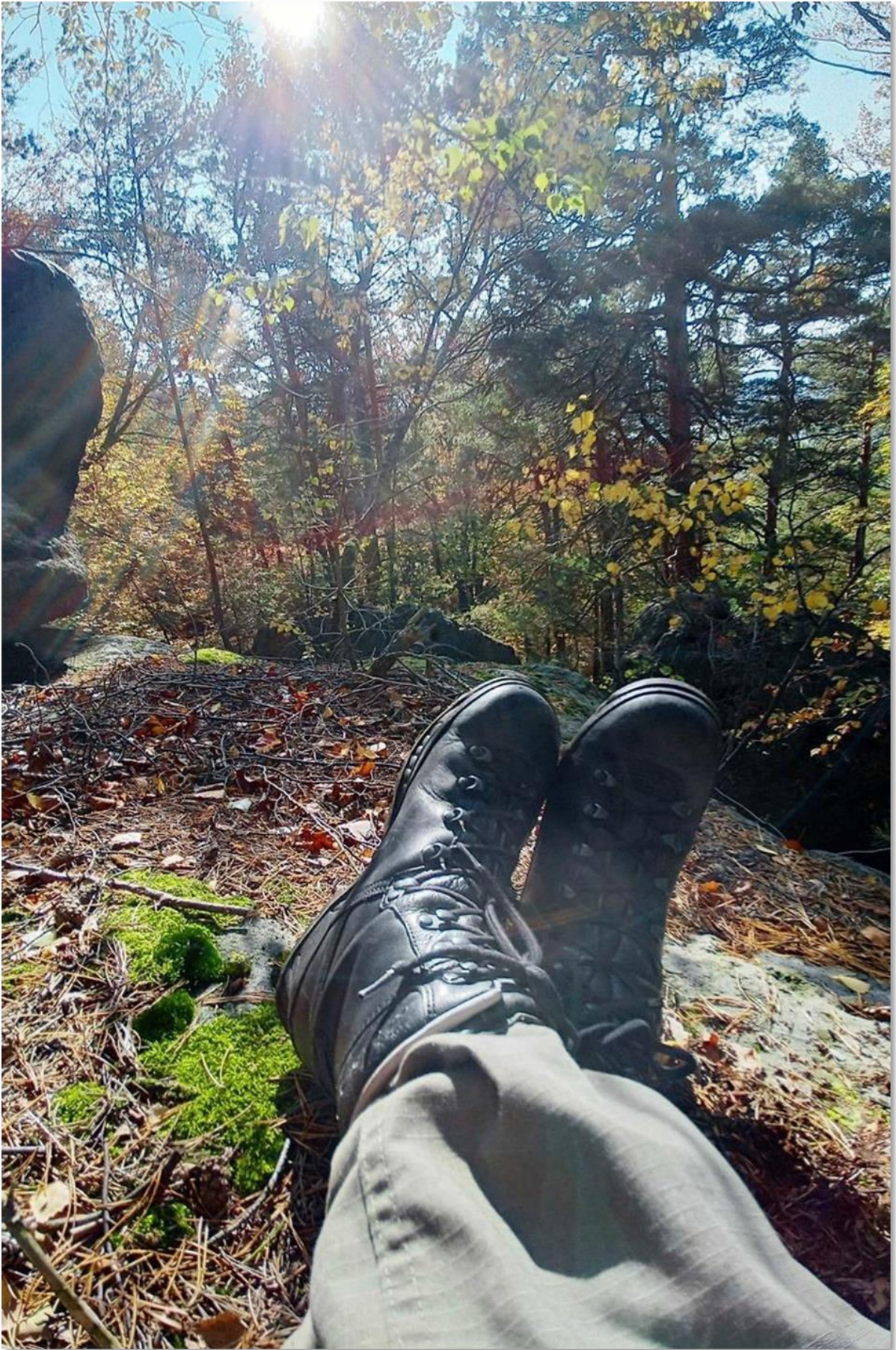
Verdiente Pause nach der Erstaktivierung der Laasensteine durch Steffen, DM3CW.