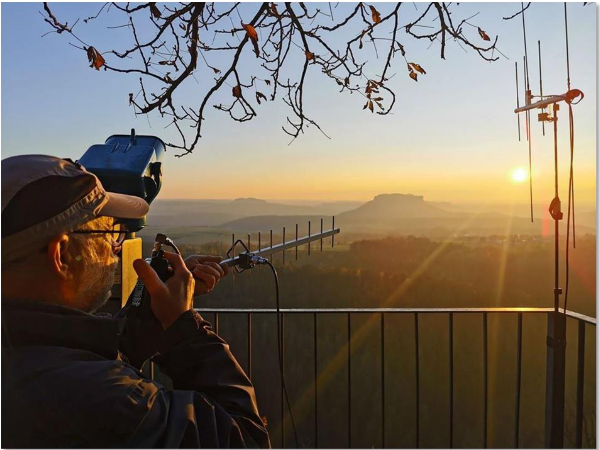
Gefunkt wird, bis die Sonne am Horizont versinkt.