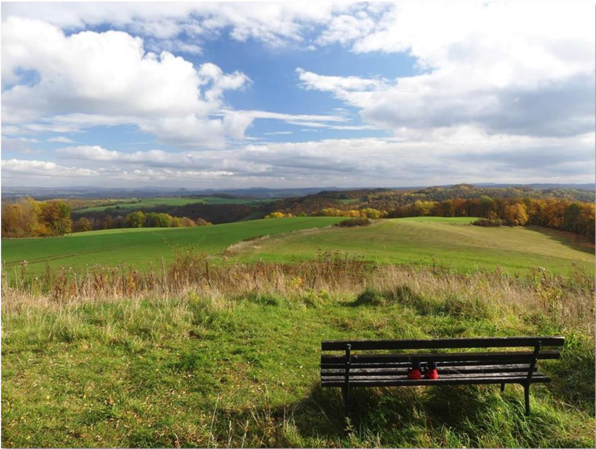
Herbststimmung auf „Dreiberge“ südlich vom Finckenfang und am Panoramablick Sächsische Schweiz oberhalb von Schlottwitz.