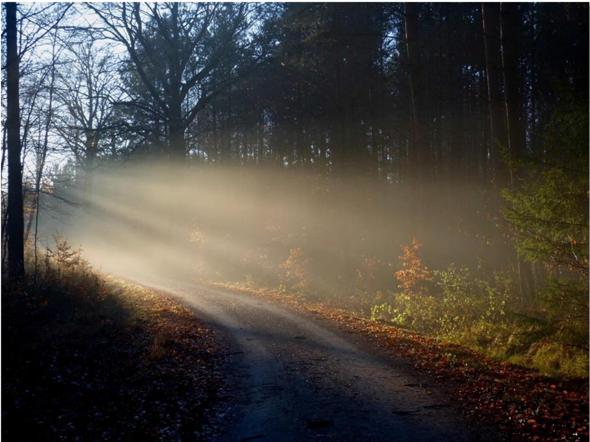
Herbststimmung auf dem Heimweg ...

Die Autoren dieses Beitrags zum ‚Sächsischen Bergkurier‘ haben ihr Einverständnis zur Veröffentlichung gegeben. Der Bergkurier dient der Berichterstattung über den ‚Sächsischen Bergwettbewerb‘ und über andere Outdoor Aktivitäten des Amateurfunks.