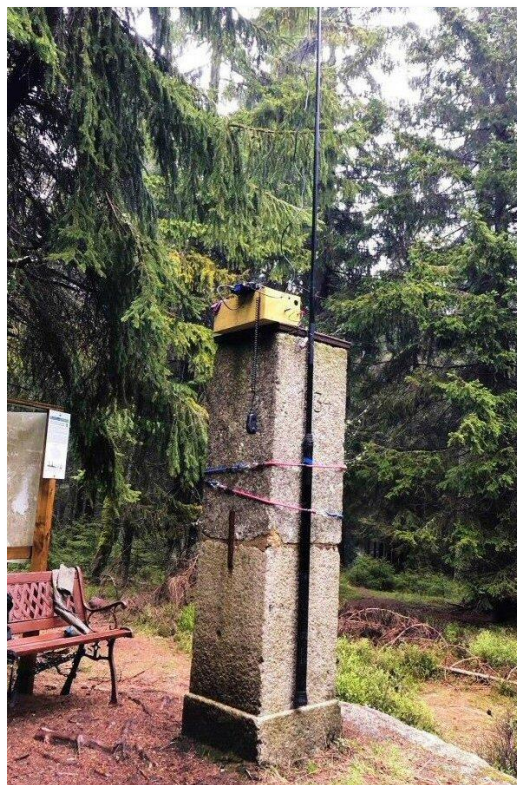
Die Trigonometrische Säule ist von 1934.