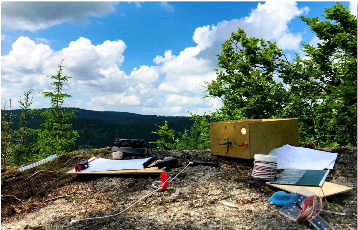
Blick vom Skaliny auf den Erzgebirgskamm mit Jelen und Rammelsberg

15km von Klingenthal liegt die Kleinstadt Rotava mit einer geologischen Besonderheit: Hier befindet sich meine Nummer 5 : OL/KA-327 - U Chaty .