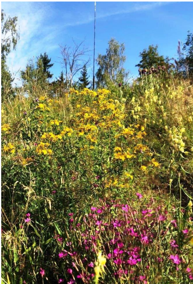
Blumenmeer auf dem U Chaty