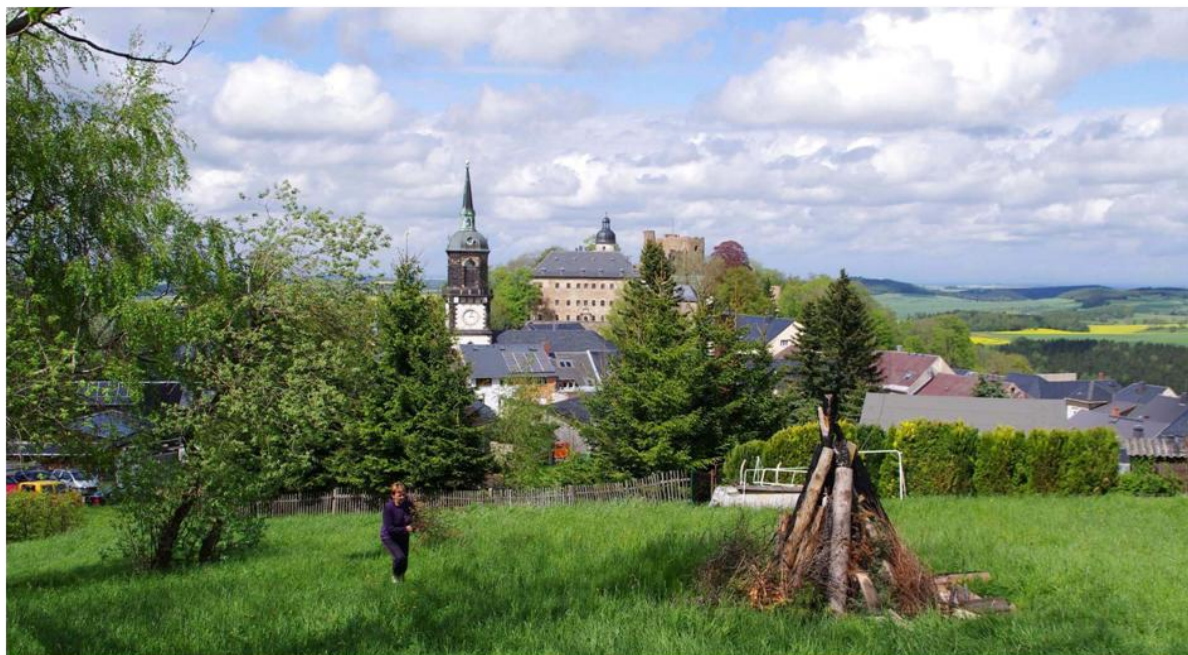
Blick zu Burgruine Frauenstein.