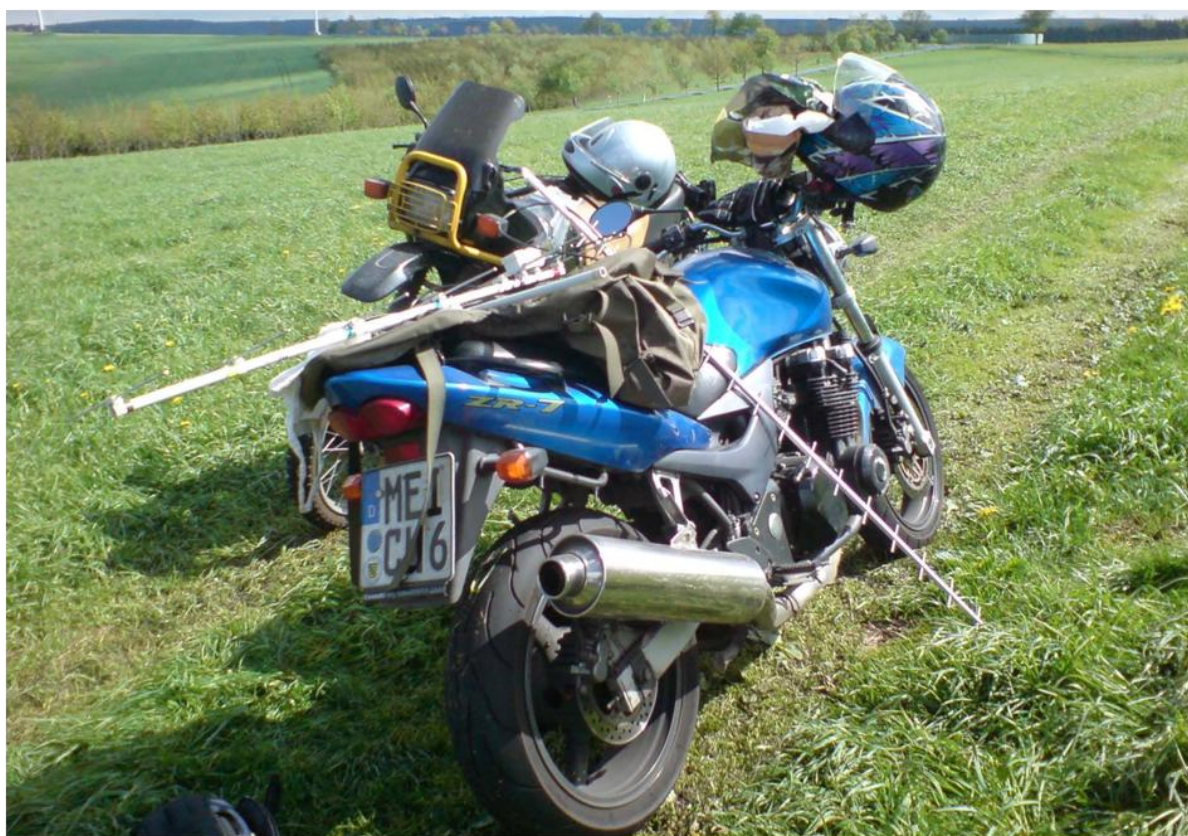
Schickels Höhe. Dirks Funkausrüstung noch auf dem Motorrad.

Viele 73 und natürlich auch 88! .Awdh und gut Funk!