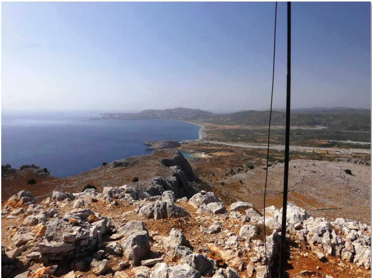
Aussicht vom Profitis Ilias nach Süden auf den Strand von Agathi