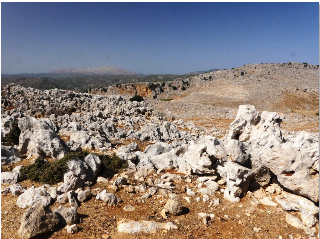
Der Großteil der Insel sieht so aus – Ein ziemlich unaufgeräumtes Durcheinander.