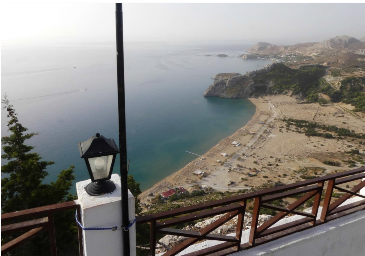
Blick vom Tsampika, SX/AG-001 hinunter zum gleichnamigen Strand.

Um noch etwas SV5 in die Luft zu bringen, versuche ich, vom Hotel aus zu funken. Doch wegen extremer Störungen wird nix daraus. Also funke ich für ein paar Stunden täglich mit kleiner Leistung aus einer benachbarten Olivenplantage.