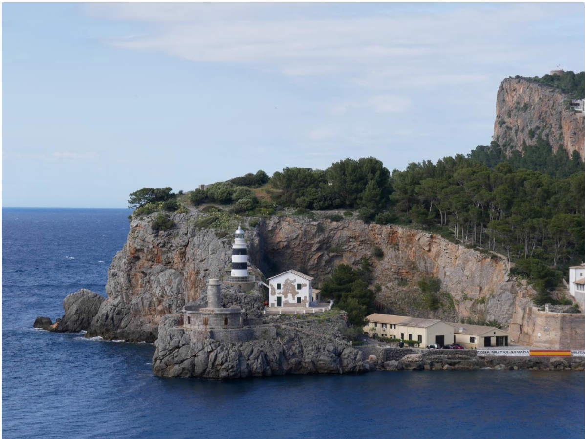
Der auf der anderen Seite der Bucht stehende Leuchtturm Sa Crua Soller.