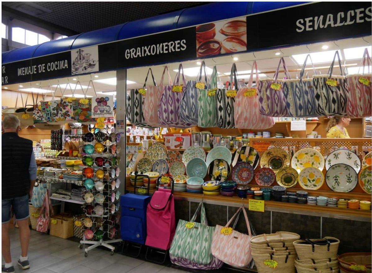
Marktplatz in Palma mit landestypischen Handarbeiten und Souvenirs im Angebot und die Kathedrale Basilika Santa Maria.