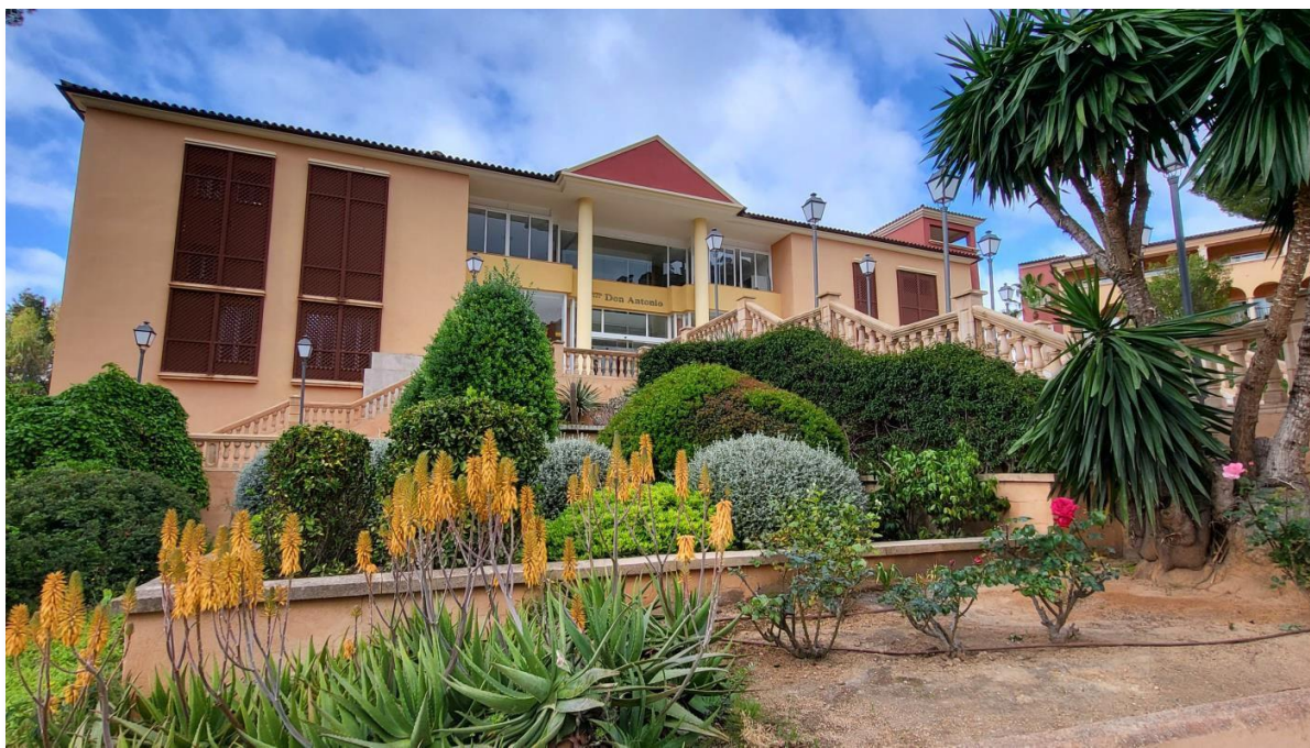
Hotel San Antonio in Paguera

Wir hatten uns ein Quartier im westlichen Teil der Insel herausgesucht, weil die Küstenlandschaft und das Tramuntana Gebirge der für uns reizvollere Teil der Insel ist. Ein Mietwagen während der Urlaubzeit gehört dazu, um die Insel besser und flexibler erkunden zu können.