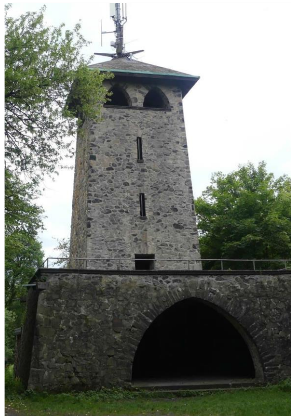
und Stoppelsberg, DA/HE-460, TOTA DLR-1729

Beide Aussichtstürme heute leider verschlossen.