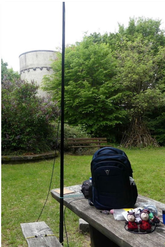
Den Altenberg, DA/HE-459, TOTA DLR-1784.

Es geht weiter ins Lahn-Dill-Bergland. Zwei relativ bequeme Ziele habe ich noch für den Nachmittag: