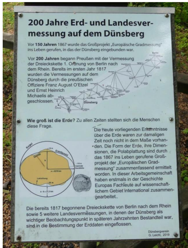
Hier ist auch die Geschichte der Landvermessung in Preußen dokumentiert.