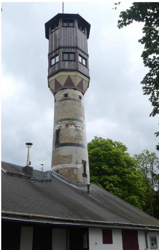
mit dem Aussichtsturm DLR-0478.

Eine bequeme Wanderung von 25 Minuten bringt mich zum nächsten Ziel, dem Dünsberg, DM/HE-518