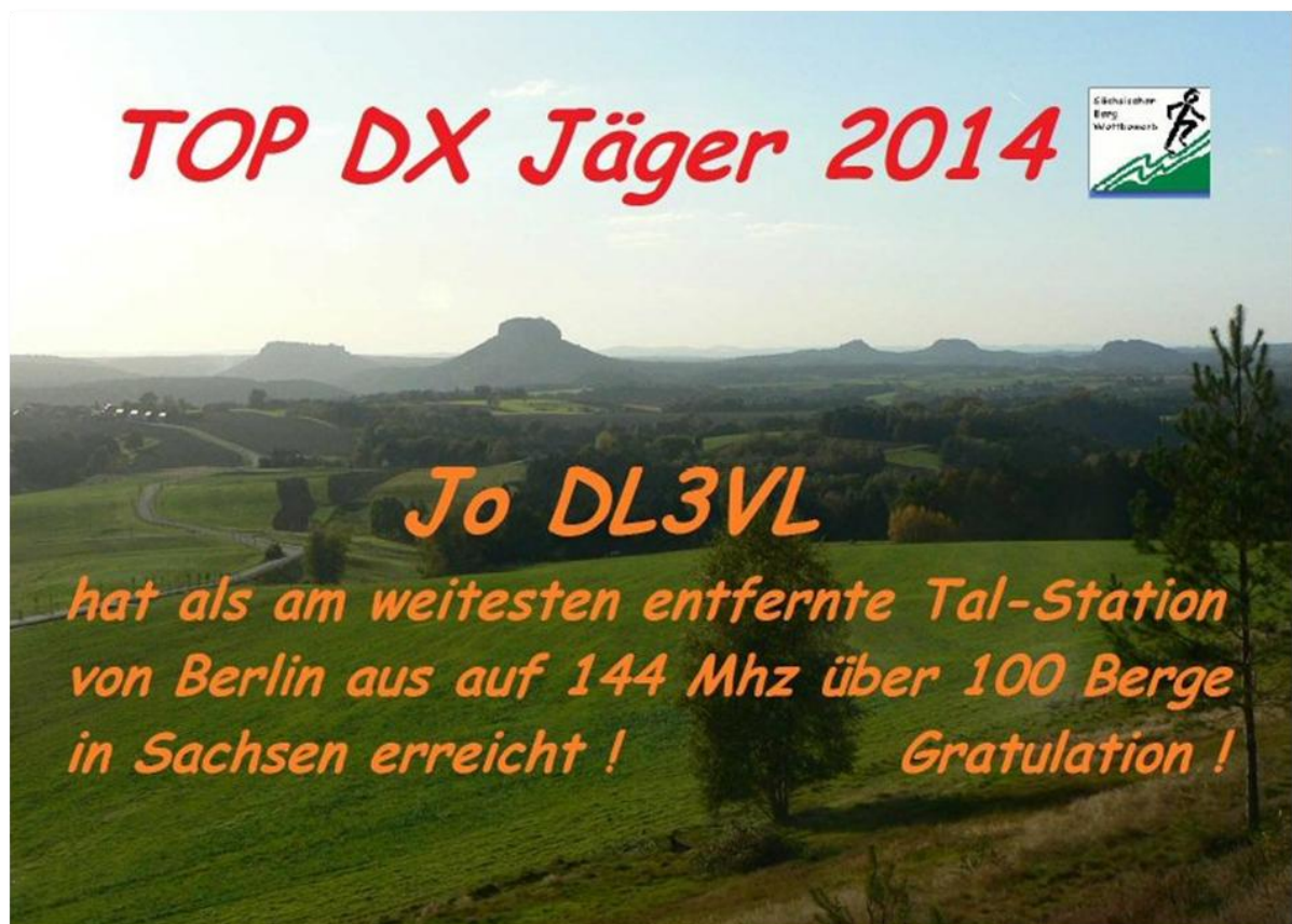
Die Anzahl der Berge ist inzwischen sicher bereits weiter angewachsen.