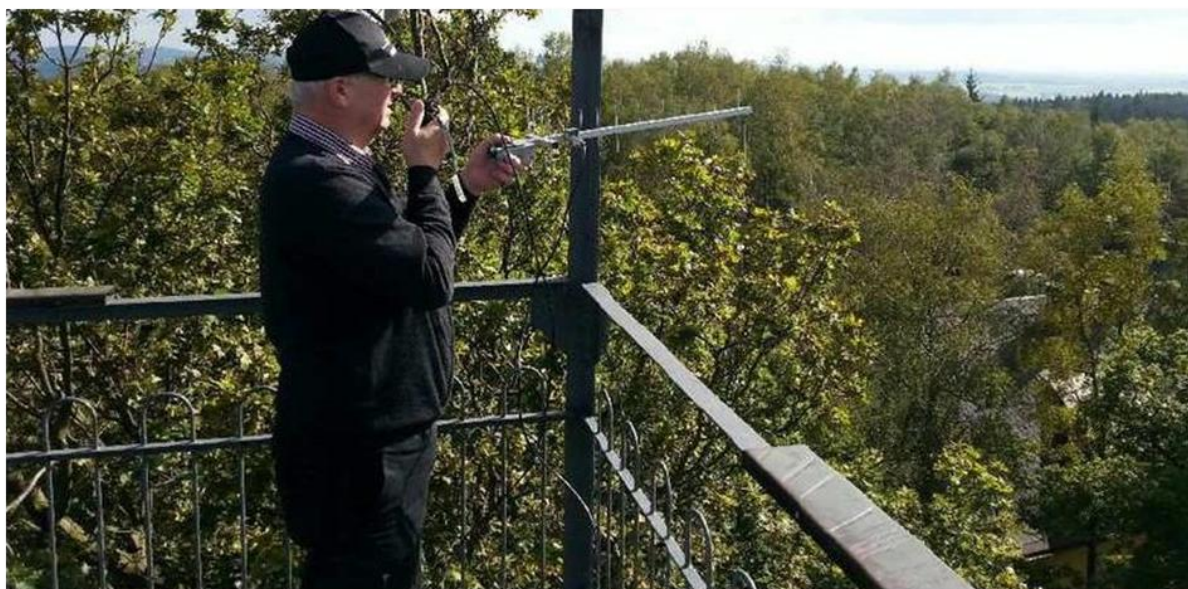
Der Turm auf dem Keulenberg wird an diesem Tag gut genutzt.

Weit über 20 Bergfreunde folgten der Einladung und auch das Wetter spielte mit.