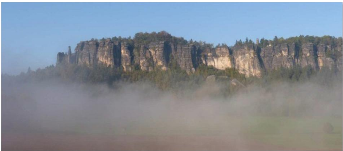
Der Pfaffenstein im Morgennebel

Zum Ende noch einige Impressionen vom goldenen Herbst von meiner Tour am 3. Oktober.