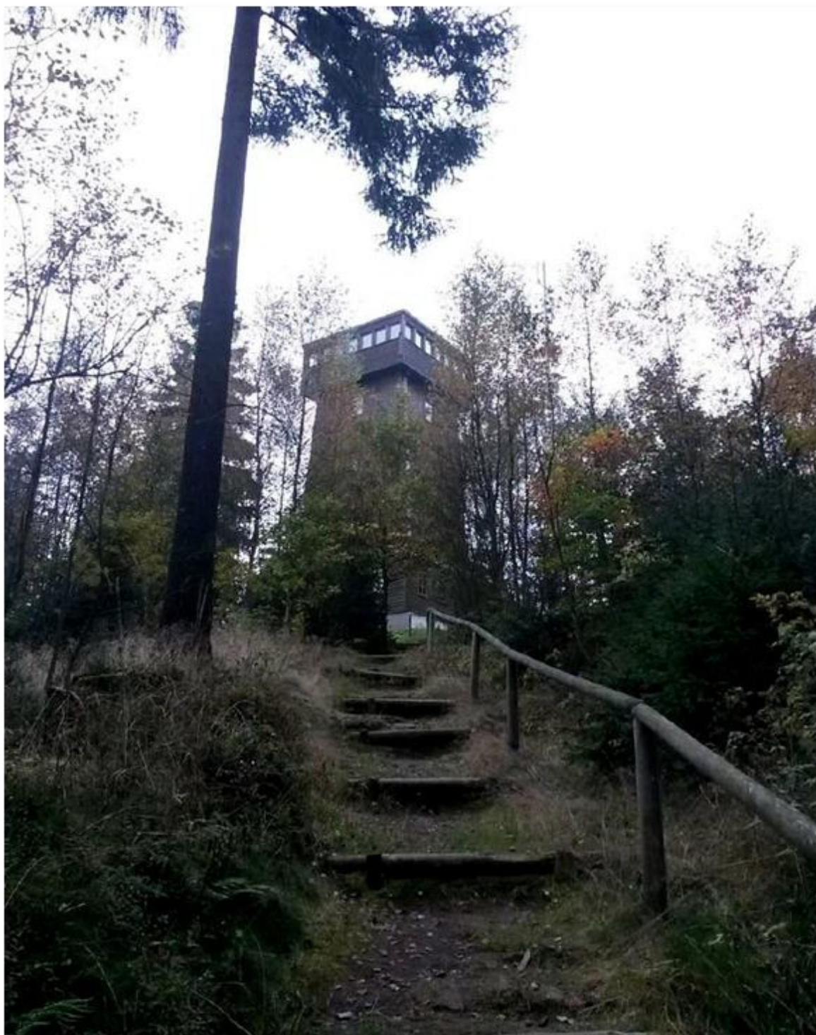
Aufstieg zum Kapellenberg bei Bad Brambach