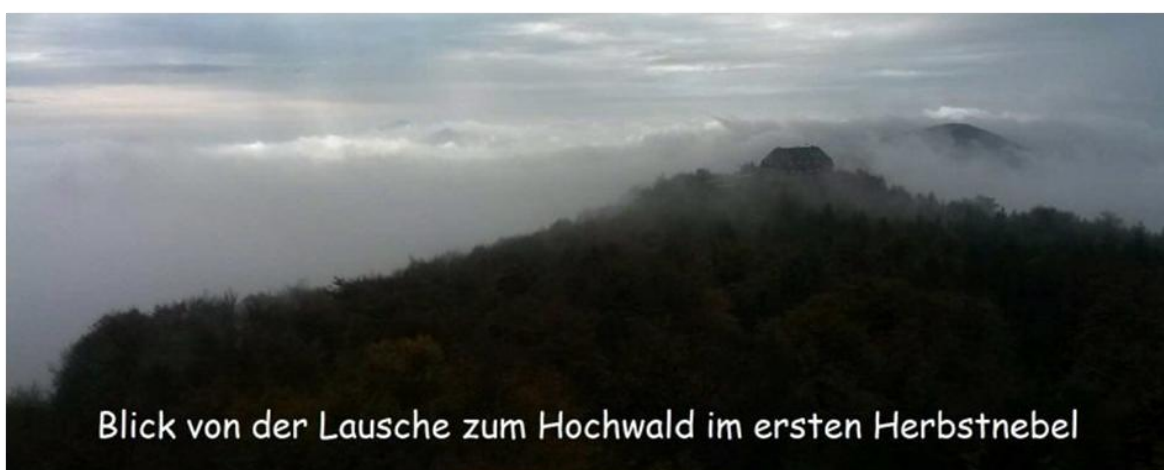
Blick von der Lausche zum Hochwald im ersten Herbstnebel