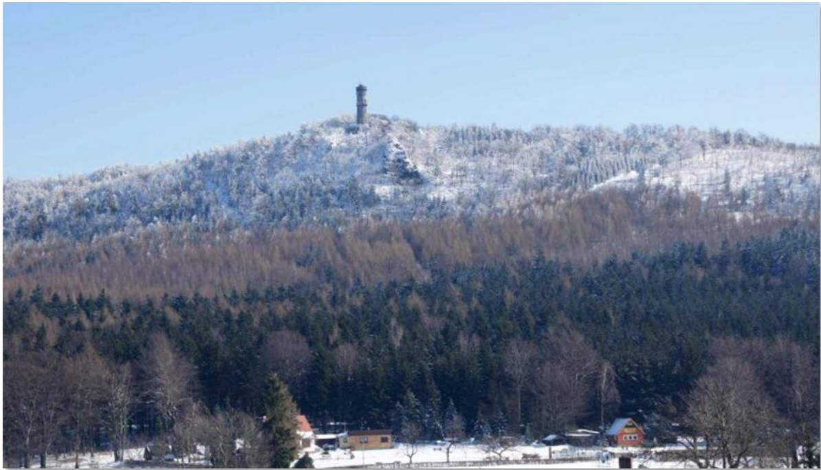
Blick zum verschneiten Hochwald --- im Winter 2013

Wenn auch schon einige Tage ins Land gegangen sind, allen Lesern die besten Wünsche für 2015!