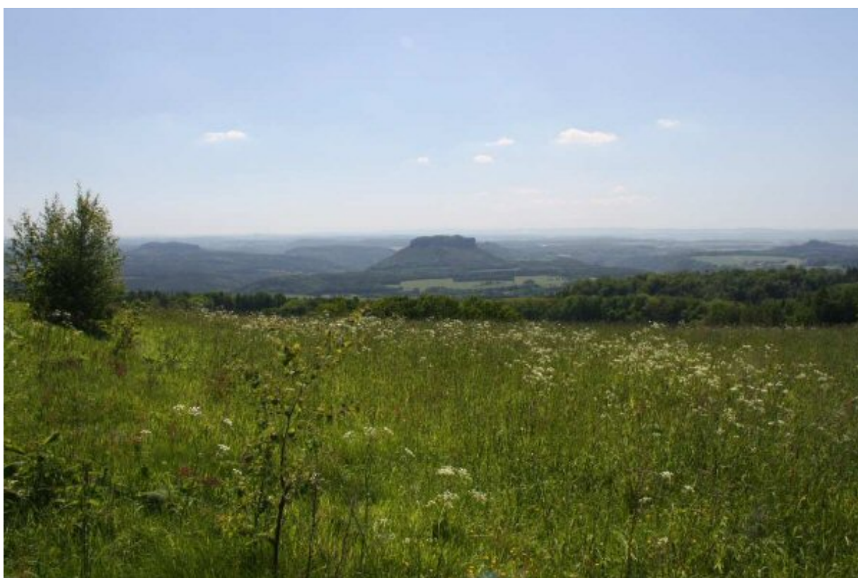
Blick von der Waitzdorfer Höhe nach Süden

Seit Juni ist meine neue Anschrift 01109 Dresden, Binzer Weg 7. Das wird ja aber erst zur Abrechnung wichtig. Per Email bin ich auch weiterhin unter ✉ dl2dxa@darcd.de erreichbar.