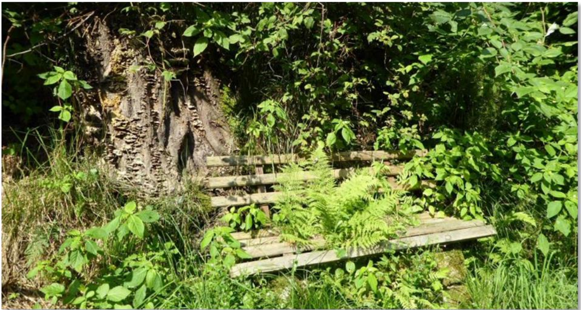
Ist das gar die „Bank des faulen Funkers“ ??