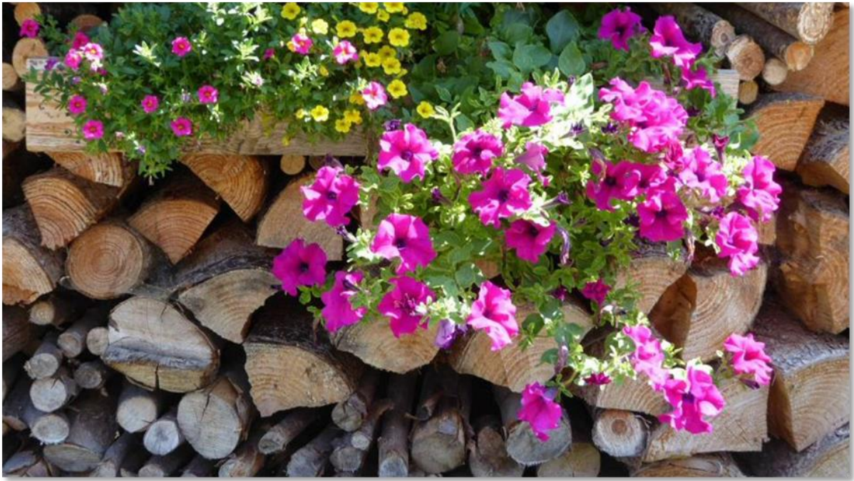
Kleingießhübel hat sich schick gemacht