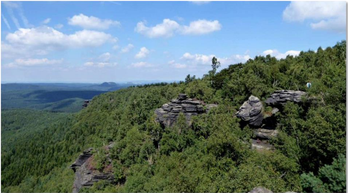
Thomas, DM2TS und Bernd, DO6BE waren gemeinsam auf dem Großen Zschirnstein qrv