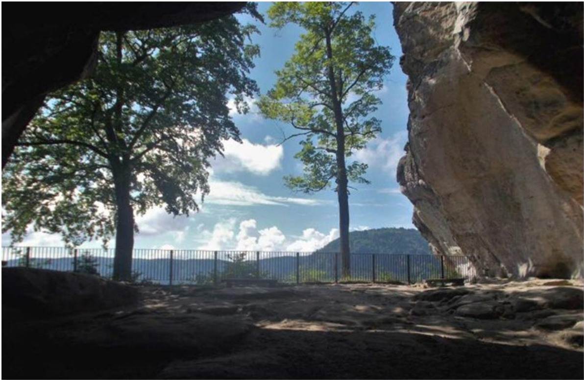
Blick aus dem Kuhstall nach Süden.