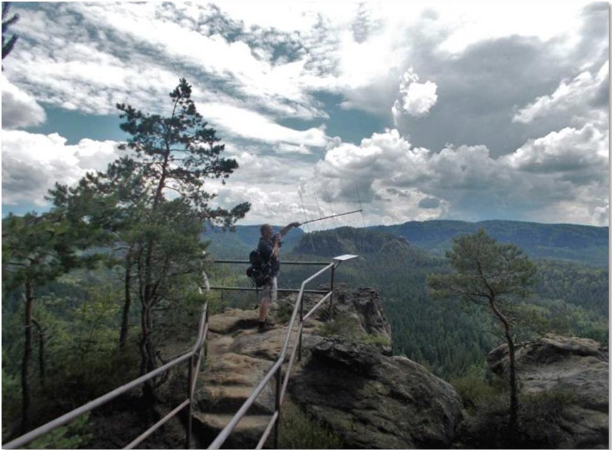
Andre, DG0DG auf dem in diesem Jahr neu hinzugekommen Großstein.